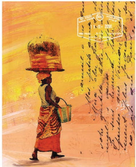
© La passante, d'après une photo prise à Abidjan, Marcoré

> à partir de 10 ans mercredi 26 octobre, samedis 29 octobre, 17 décembre, mercredi 21 décembre à 15h > durée : 2h > sur inscription