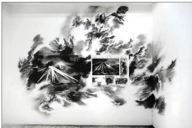
Abdelkader Benchamma, 2016