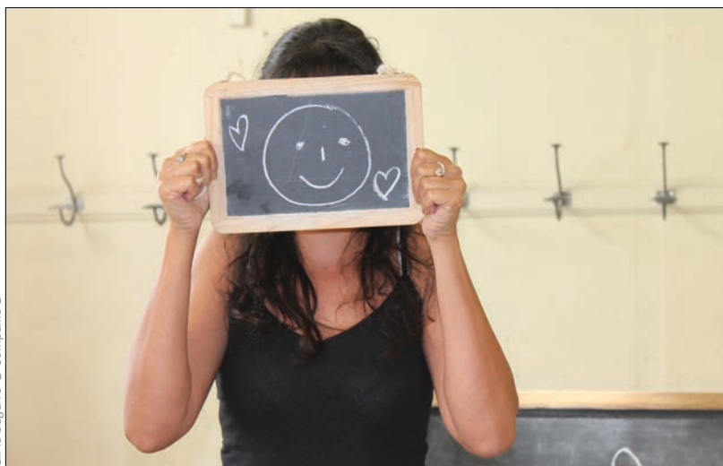
Lili la bagarre © Compagnie L